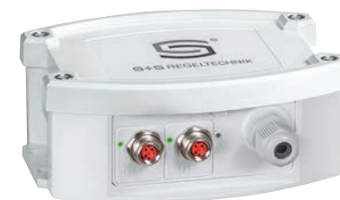
EtherCATP conexión de cable e indicación de estado LED